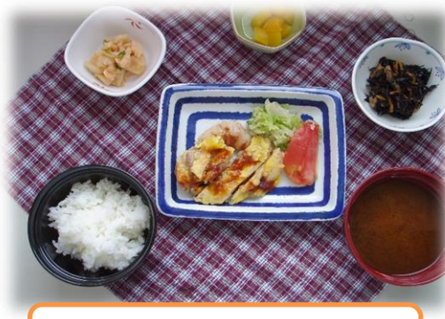
6/20 セレクトメニュー