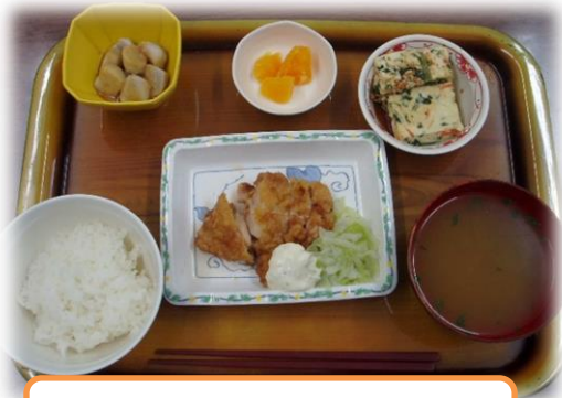
6/10 宮崎県 郷土料理