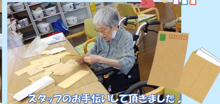
スタッフのお手伝いして頂きました！