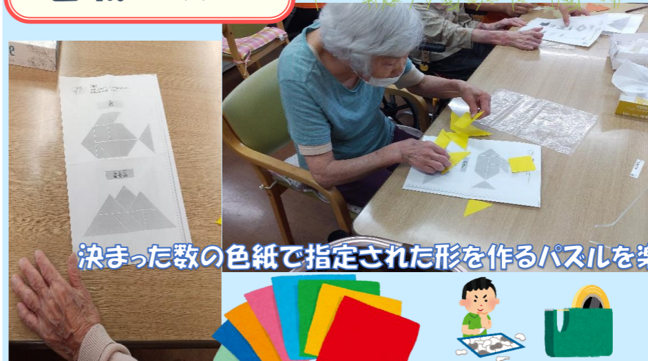
決まった数の色紙で指定された形を作るパズルを楽しんで頂きました♪