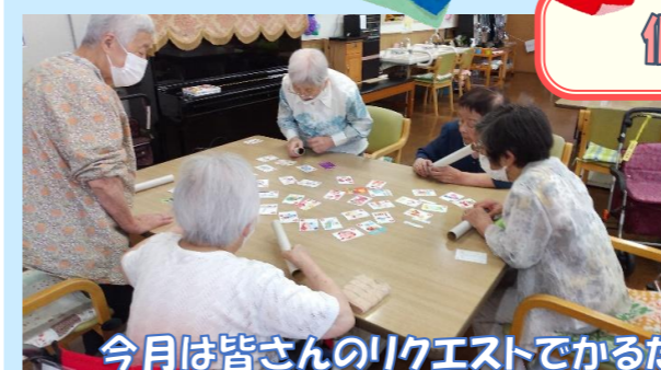
今月は皆さんのリクエストでかるた取りを行いました。